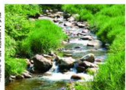
豊かな自然が誇る金城町