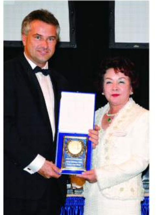
品質の高さが認められ、2007年から7年連続でモンドセレクション最高金賞を受賞している