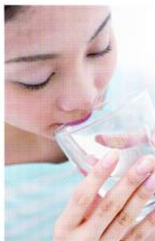
水は、喉が潤いてからではなく、気付いた時に少しずつ飲む方がよい